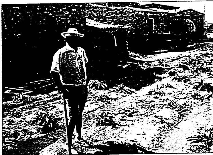
El regadío tradicional ha crecido en los últimos años

Con este nuevo sistema, las variaciones que se produzcan en los datos que constan en el padrón de habitantes, tales como expedición del Documento Nacional de Identidad (DNI), tarjeta de residencia de extranjeros, nacimientos, defunciones, expedición o reconocimientos de títulos escolares o académicos, entre otras, se irán anotando sobre la base del padrón que se elabore durante 1996.