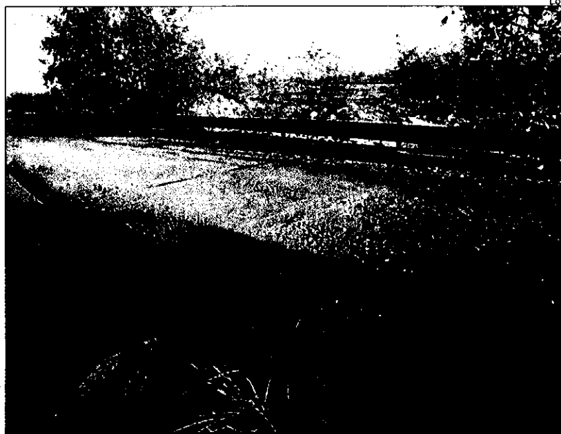
La Confederación comprobó que la empresa había construido una red de tuberías

La segunda de las multas, que han sido tan importantes como el resto de todas las sanciones emitidas desde el organismo de cuenca, se presenta también por venta irregular de los recursos procedentes del trasvase Tajo-Segura.