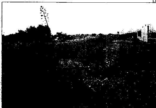
Una tubería cruza una carretera sacando el agua del perímetro del trasvase

Asimismo, López Bernal visitó cada una de las presuntas ampliaciones de regadíos de la zona, que según los cálculos de la Confederación podrían llegar incluso hasta las 2.000 hectáreas. La legislación de aguas española prohíbe desde el año 1986 que en la cuenca del Segura se amplíen regadíos y haya nuevas concesiones en la zona, que abarca la provincia de Murcia, así como zonas de Alicante, Almería y Albacete, ya que el déficit de 350 hectómetros cúbicos hace inviable la utilización de agua de la propia cuenca.