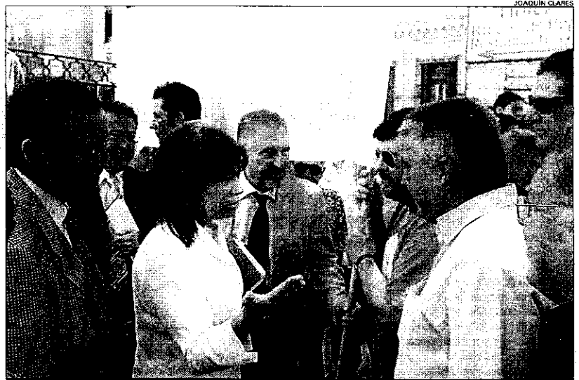
La ministra Cristina Narbona pide a los agricultores del Altiplano que demuestren sus derechos al agua del PHN

Asimismo, en la contestación del Ministerio a Francisco Abellán se recuerda que "en su primera visita a Murcia, la ministra de Medio Ambiente solicitó a los regantes del Altiplano documentación sobre compromisos legales donde figurara el reconocimiento de derechos sobre los 42 hectómetros cúbicos anuales.