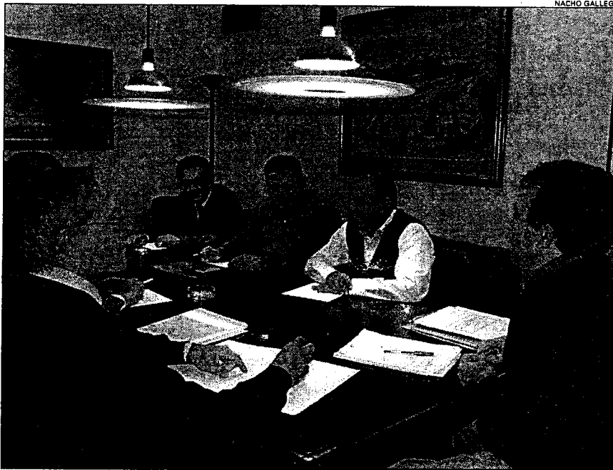
El consejero de Agricultura, Antonio Cerdá, a la derecha, en una reunión del foro del agua, en foto de archivo

La Consejería quiere poner orden en la agricultura de regadío de la Región, que según el Plan de cuenca del Segura tiene una extensión de unas 240.000 hectá-