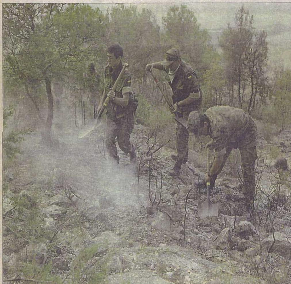
Pese a los esfuerzos realizados para contener el incendio, una vez más se puso de manifiesto la escasez de medios, especialmente aéreos.

Dos días después, el fuego sigue incontrolado y ha arrasado 20.000 hectáreas de masa forestal en el Noroeste