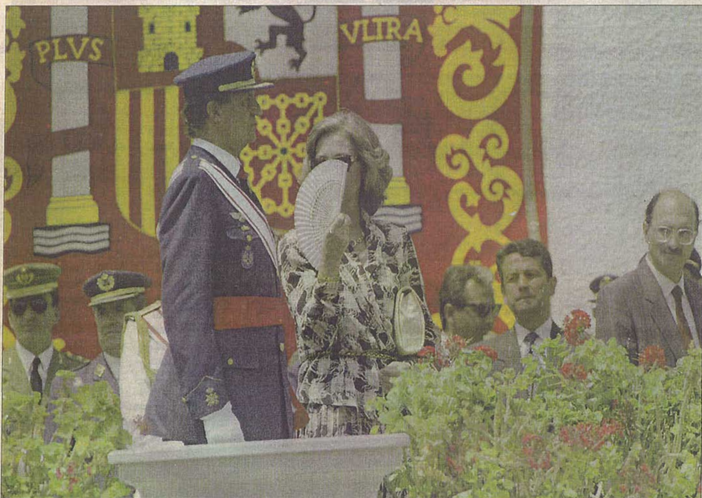
Don Juan Carlos y Doña Sofía, que se protege del calor con un abanico, presidieron el desfile militar que acompañó a la entrega de despachos en la Academia General del Aire.